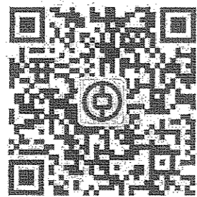
关注中行山西分行